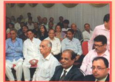
સન્માન પ્રસંગે હકડેહક જેજેસી પરિવાર – લોકચાહનાની અપૂર્વ અભિવ્યક્તિ !