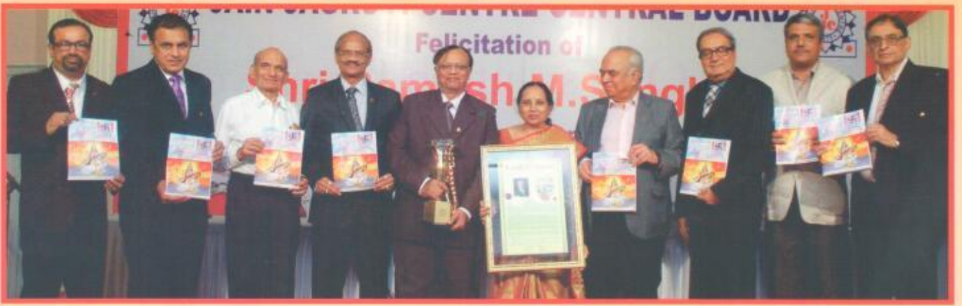
જાગૃતિ સંદેશના તંત્રીનું સજોડે સન્માન