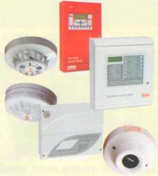
Fire Detection & Alarm Systems