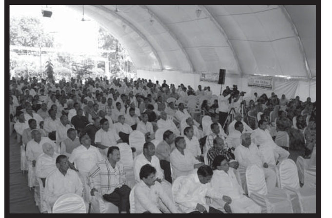
નિમ્બાહેડા સેન્ટરના ઉદ્ઘાટન પ્રસંગે એકત્રિત જૈન પરિવારો

જૈન જાગૃતિ સેન્ટર-સેન્ટ્રલ બોર્ડ આયોજિત આગામી કાર્યક્રમ