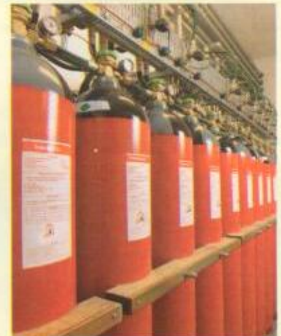
Gaseous Fire Suppression Systems