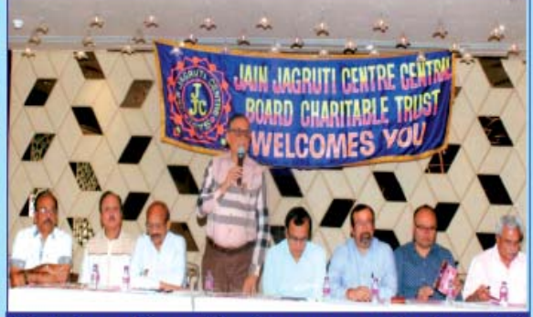
જેજેસી સેન્ટ્રલ બોર્ડના પદાધિકારી તથા સમૂહલગ્નનાં સર્વ દાતાશ્રીઓ