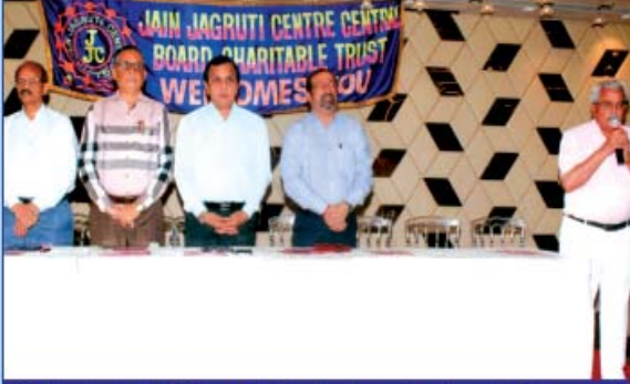
જેજેસી સેન્ટ્રલ બોર્ડના પદાધિકારીઓ નવકાર મંત્રનો ઉચ્ચાર કરતાં