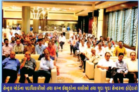
સેન્ટ્રલ બોર્ડના પદાધિકારીઓ તથા લગ્ન ઈચ્છુકોના વાલીઓ તથા જુદા જુદા સેન્ટરના હોદ્દેદારો