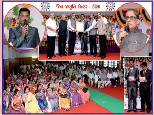
જેજેસી-ડીસા પદગ્રહણ સમારોહ