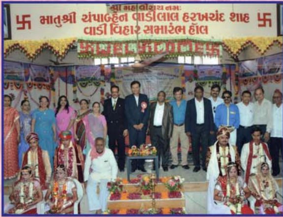
જેજેસી-સુરેન્દ્રનગર આયોજીત ૨૨મો સમૂહલગ્ન