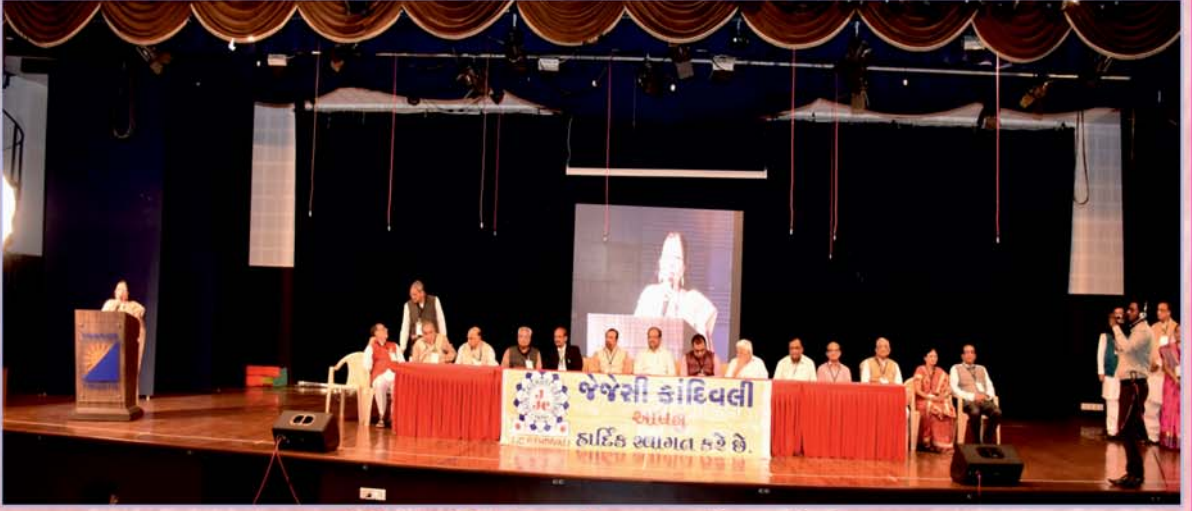
જેજેસી-કાંદિવલી આયોજીત સાતમો યુવા મેળો