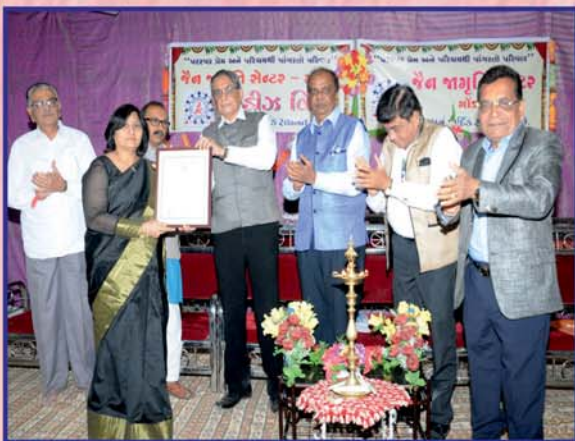
જેજેસી-લેડીઝ વીંગ ગોલ્ડ ચાર્ટર્ડ ઓપનીંગ