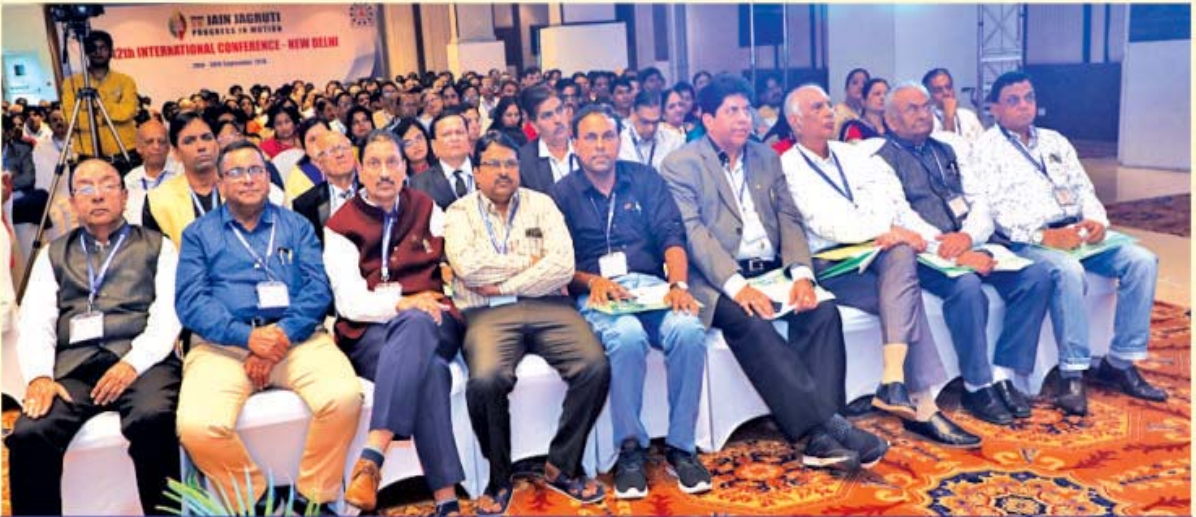
જૈન જાગૃતિ સેન્ટર સેન્ટ્રલ બોર્ડ દ્વારા આયોજિત ૨૦૧૮ કોન્ફરન્સ દિલ્હી હોટલ ઢારકા ખાતે દરેક સેન્ટરના પદાધિકારીઓ