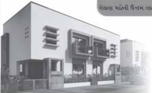
સેક્ટર માટેની ઉત્તમ તક