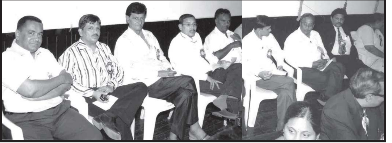
મંચ પર બિરાજેલ જે.જે.સી.-ઉત્તરગુજરાતના પ્રમુખશ્રીઓ

લેડિઝ વિંગ મહેસાણા આયોજિત સ્નેહકુંજ-૨૦૦૯ના યાદગાર ક્લીપ્સ