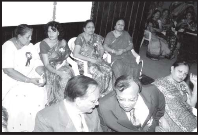
મંચ પર બિરાજમાન જે.જે.સી.-લે. વિ.નાં પ્રમુખશ્રીઓ